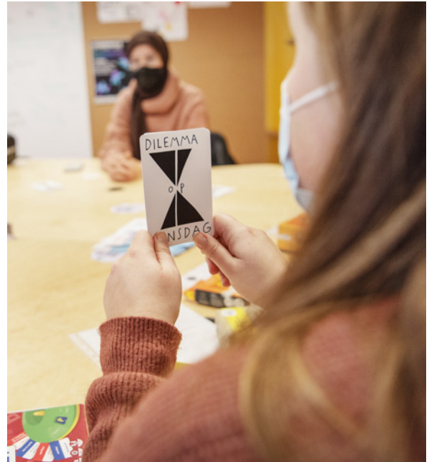
PIM PAM PRAAT

In overleg met het publiek werden de oefenkanalen Nederlands zo goed mogelijk aangepast aan de noden van de deelnemers. Zo kwam er op vraag van de deelnemers een activiteitenaanbod tijdens de schoolvakanties, stond het publiek zelf in voor de film- of seriekeuze van Cinema NL en werden de frequentie en het tijdstip van Pim Pam Praat, Samen Lezen NL en Cinema NL samen met het publiek bepaald. Ook bleef Cinema NL los van de coronamaatregelen online doorgaan en vond het 's avonds plaats, zodat personen die overdag werken of studeren ook konden deelnemen. Voorts gingen vanaf september de Babelut-conversatietafels in samenwerking met het Huis van het Nederlands opnieuw door, met beperkte plaatsen en op vertoon van het Covid Safe Ticket. Ondanks de coronamaatregelen vonden in totaal 101 activiteiten plaats voor 901 anderstaligen die Nederlands willen oefenen.