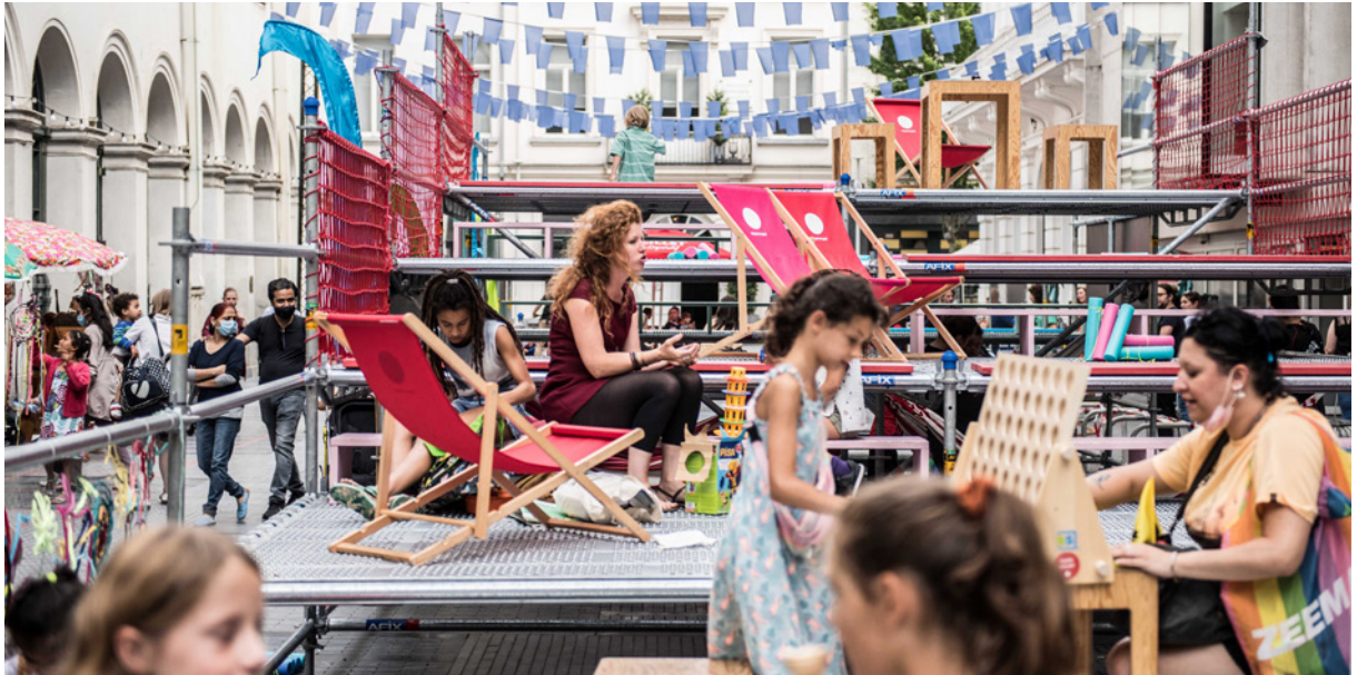
VLAANDEREN FEEST, BRUSSEL DANST

plekken waar ze terecht kunnen om Nederlands te oefenen. Brussels Academy vond in Muntpunt een partner voor een reeks lunchlessen in samenwerking met Masereelfonds, die intussen goed scoren bij het publiek.