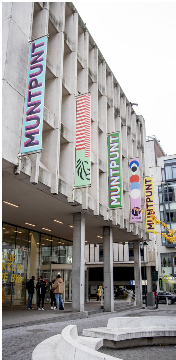
MUNT PUNT GEBOUW

Om de werking te optimaliseren en om samenwerking en persoonlijke groei te stimuleren, bundelt Academie Muntpunt elk jaar een gevarieerd aanbod van opleidingen, kennisdeling, coaching en teambuilding. Ondanks alweer een coronajaar nam het aantal activiteiten toe: in 2021 stonden 64 activiteiten (ten opzichte van 43 in 2020) op de teller, met in totaal 1214 deelnemers (tegenover 811 in 2020). Het gros van de activiteiten vond noodgedwongen online plaats. Opmerkelijke vaststelling: de onlineactiviteiten - vooral rond interne kennisdeling - zijn helemaal ingeburgerd.